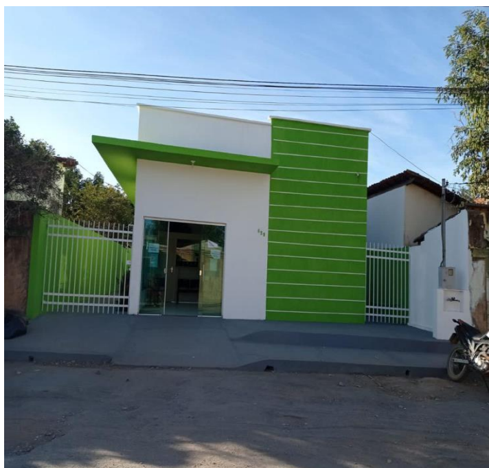
VISTA DA FACHADA