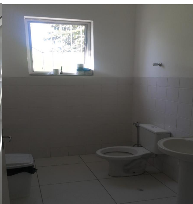
VISTA DO BANHEIRO DOS FUNCIONÁRIOS