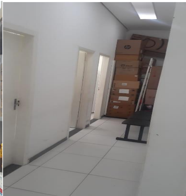
VISTA DA CIRCULAÇÃO DOS FUNDOS