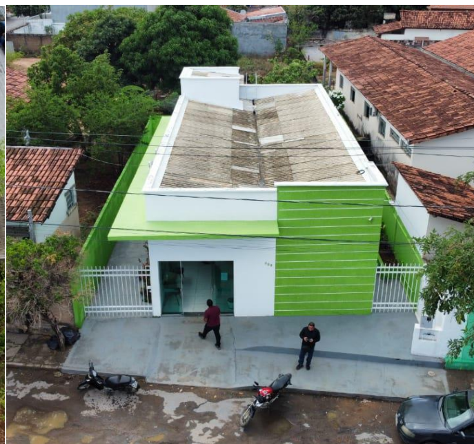
VISTA AÉREA DA FARMÁCIA BÁSICA.