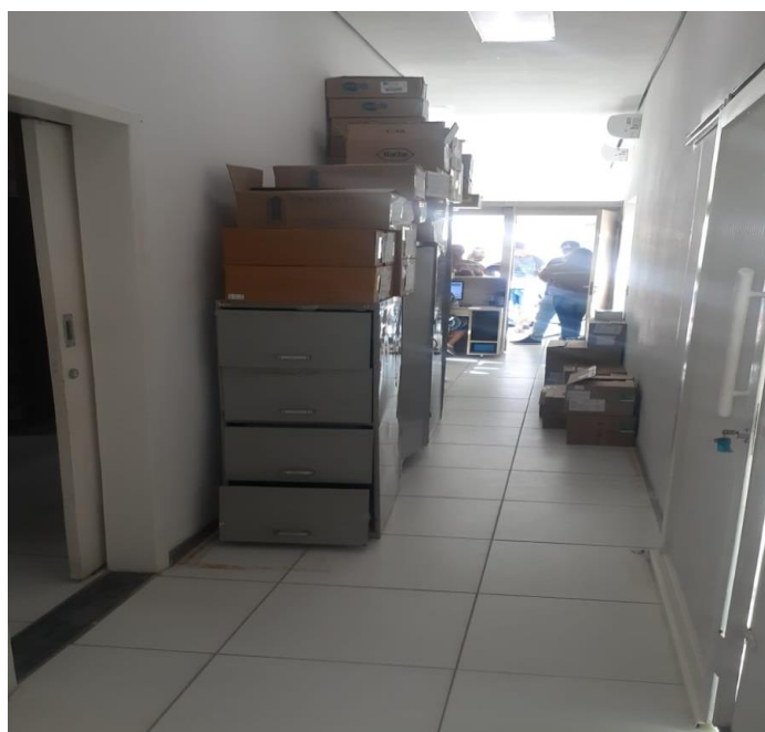
VISTA DA CIRCULAÇÃO LATERAL