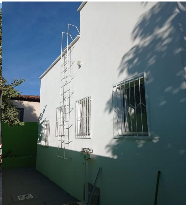
VISTA DOS FUNDOS