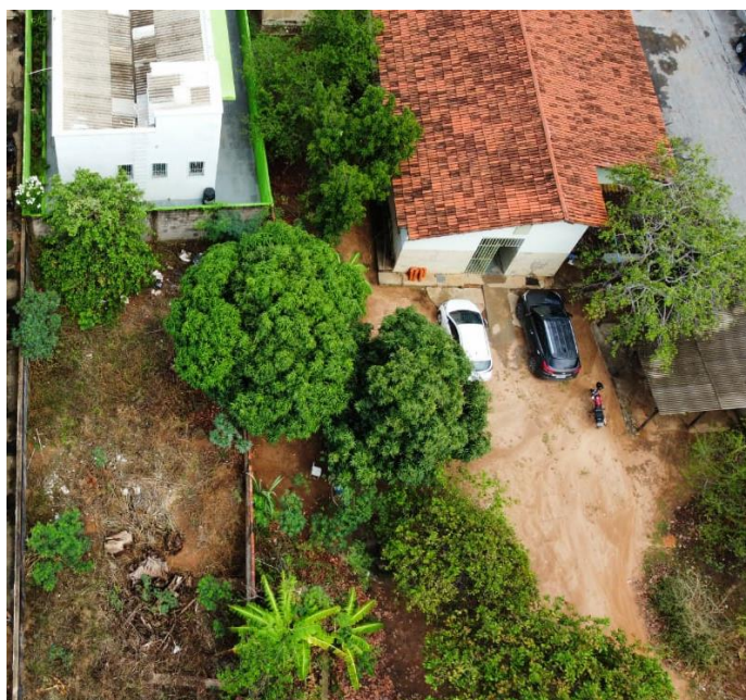
VISTA AÉREA DO TERRENO 02