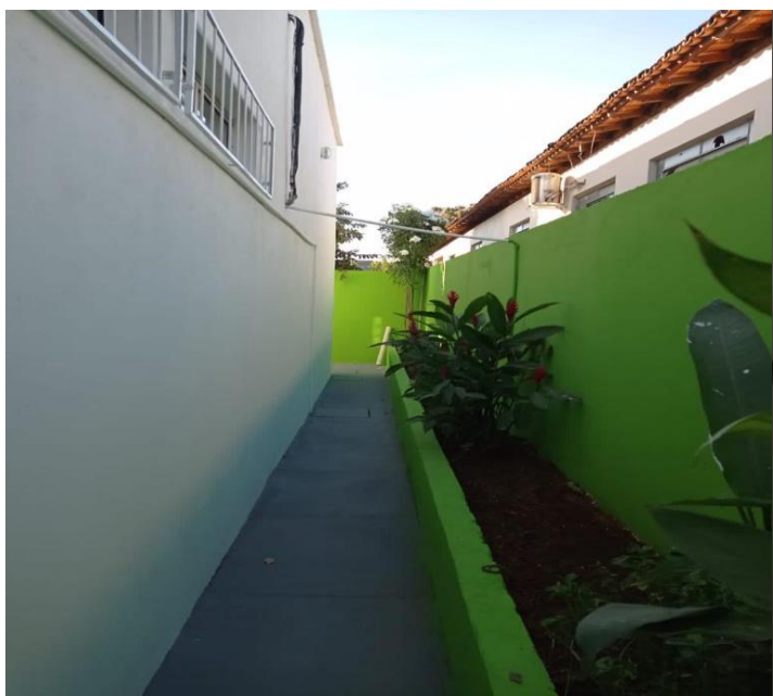
VISTA LATERAL DIREITA