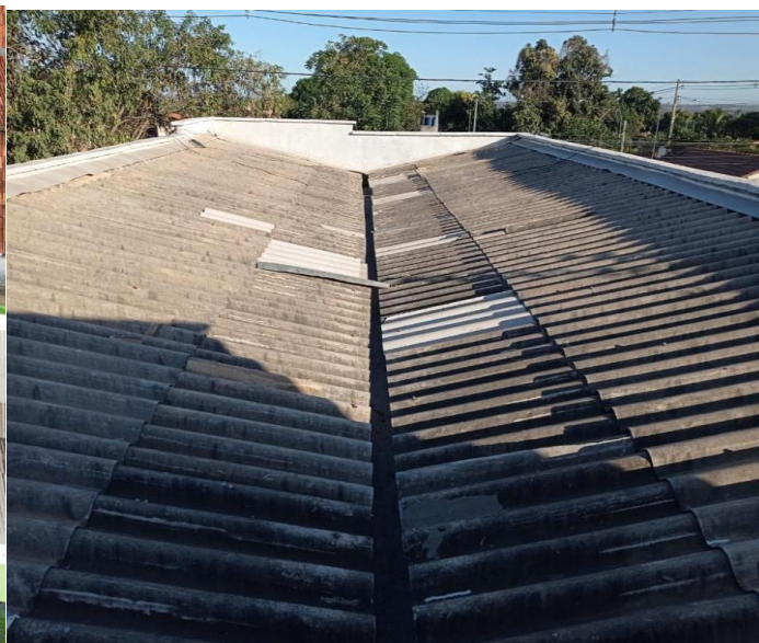
VISTA DA COBERTURA