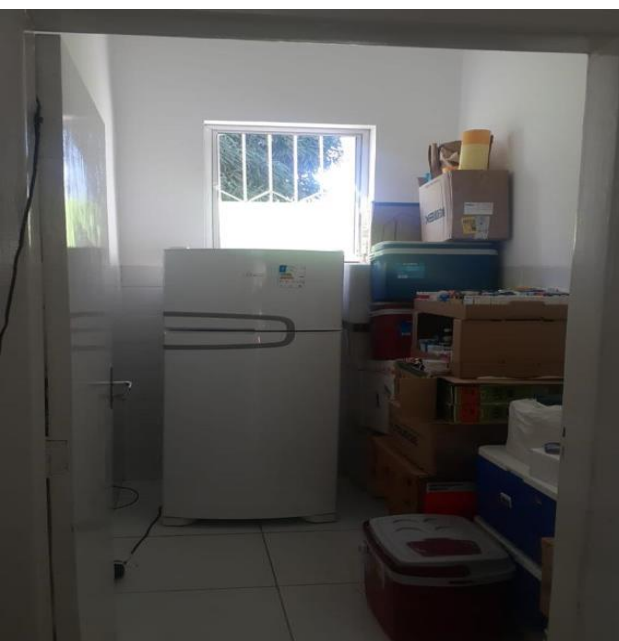
VISTA DA COPA

Data do registro: 21/02/2023.